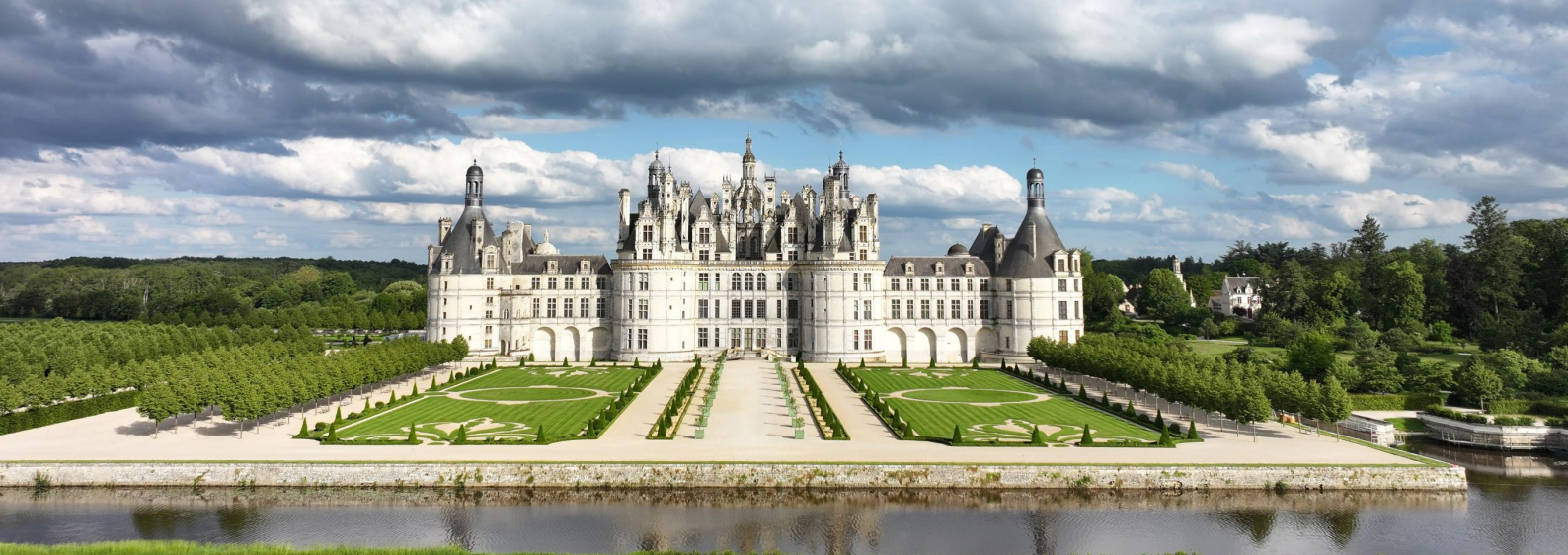
Le Domaine national de Chambord