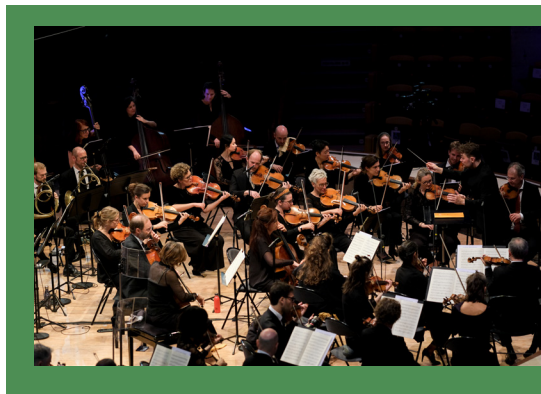
Les Siècles © Pauline Cluzeau

Catégorie 2 : 30 € (plein tarif) / 25 € (tarif réduit)