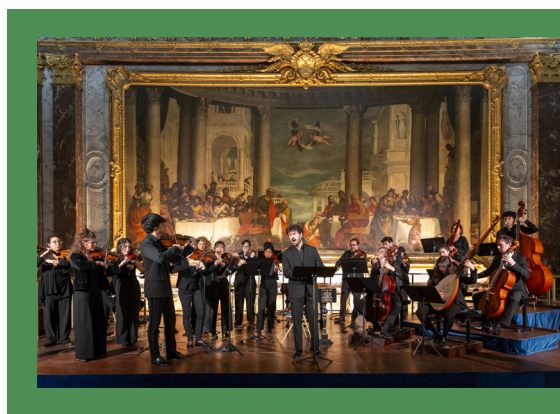
Orchestre Royal de Versailles

Catégorie 2 : 30 € (plein tarif) / 25 € (tarif réduit)