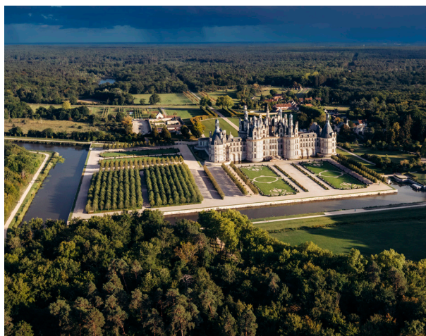
Domaine national de Chambord

Le château de Chambord, construit à partir de 1519 et dont l'intégrité est préservée depuis, est un symbole majeur de la Renaissance française et une prouesse architecturale notamment incarnée par un escalier à double révolution inspiré des travaux de Léonard de Vinci. Le château et son vaste domaine forestier de 5 440 hectares appartiennent à l'État français en charge de leur conservation et de leur restauration. Le domaine, réserve nationale de faune et de flore sauvage, abrite des habitats rares et des espèces protégées. Chambord est placé sur la première liste des monuments historiques français dès 1840 et inscrit au patrimoine mondial de l'UNESCO depuis 1981.