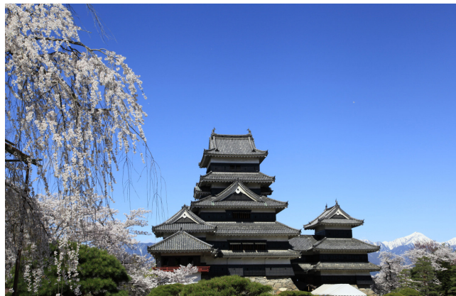
Château de Matsumoto

Le château de Matsumoto se distingue par son donjon d'un noir profond qui se dresse majestueusement devant les Alpes japonaises. À l'instar des châteaux de Himeji, Hikone, Inuyama et Matsue, il est classé trésor national. Construit durant la période Sengoku (période des Royaumes combattants), aux XV e et XVI e siècles, il abrite le plus ancien donjon toujours en état. Le donjon a été construit en temps de guerre, tandis que la tour d'observation de la lune (Tsukimi Yagura), a été ajoutée en temps de paix. Ces styles architecturaux de différentes époques coexistent en harmonie. Le château de Matsumoto est un symbole de la ville éponyme.