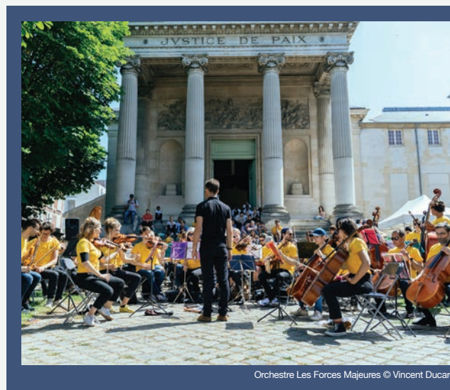
Orchestre Les Forces Majeures

[Cat. A/parterre : 50€ / 35€ - Cat. B/gradin : 30€ / 20€]