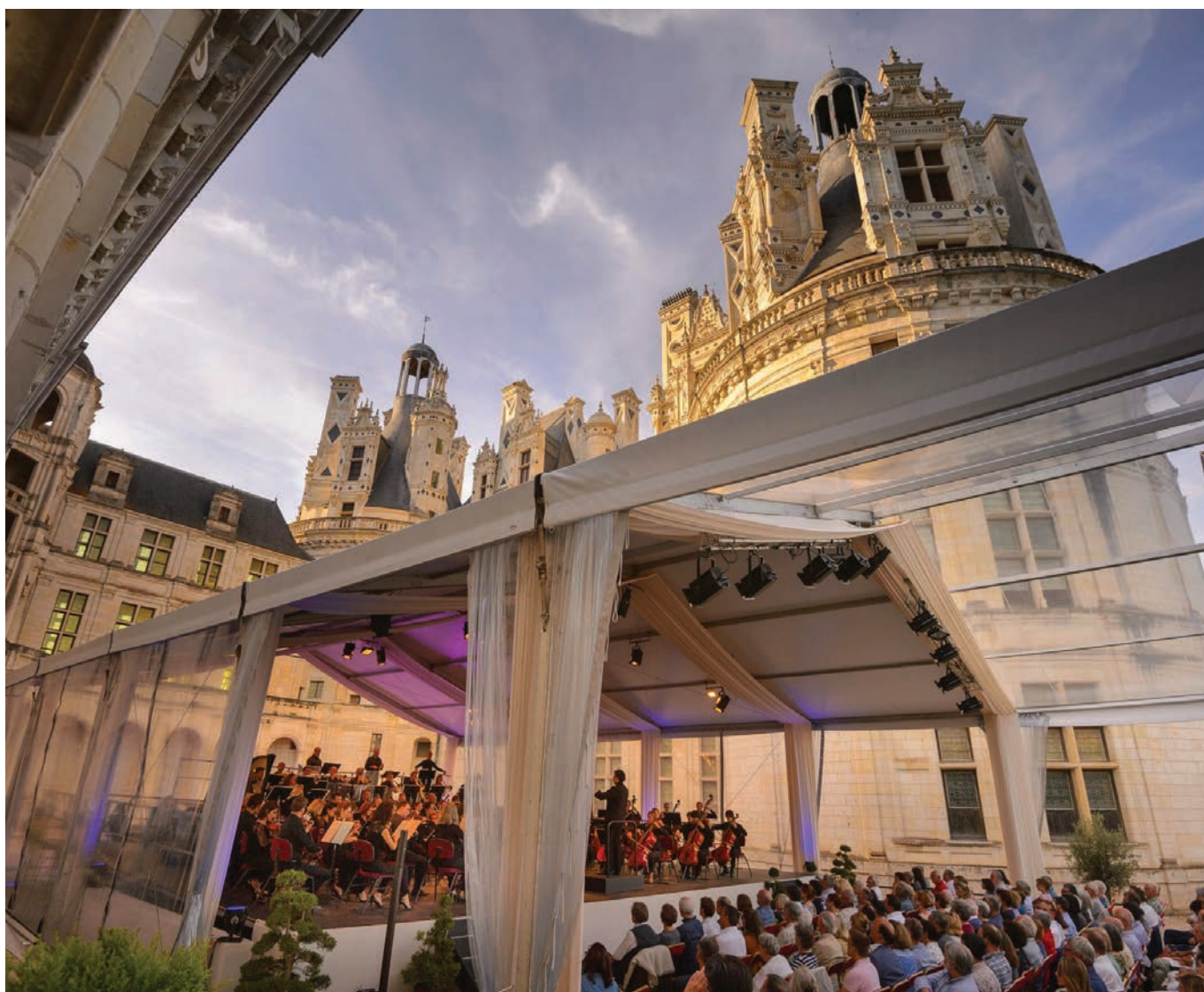
Festival de Chambord

Tous les ans, le Festival permet de mettre en place des actions « d'Éducation Artistique et Culturelle » en direction des publics dits empêchés. En partenariat avec l'association Cultures du Cœur 41, des places sont offertes pour une série de concerts ciblés et une rencontre est programmée le 7 juillet entre les artistes (musiciens et danseurs) et une cinquantaine de personnes vivant dans la ZUP nord de Blois qui assisteront ensuite au spectacle. De plus, un concert gratuit est organisé en avril dans l'un des villages de la Communauté de communes du Grand Chambord, manière d'aller à la rencontre du public rural de proximité afin de lui présenter cette 13 e édition – qui mélange musique savante et musique dite « populaire » – et de lui offrir un spectacle de près d'une heure donné par l'un des ensembles invités lors du Festival. Cette année, il s'agit d'une émanation de l'Orchestre Symphonique du Loiret. Enfin, des artistes offrent un goûter musical de 45 mn aux résidents d'un des EHPAD du territoire avant de se produire en soirée au château.