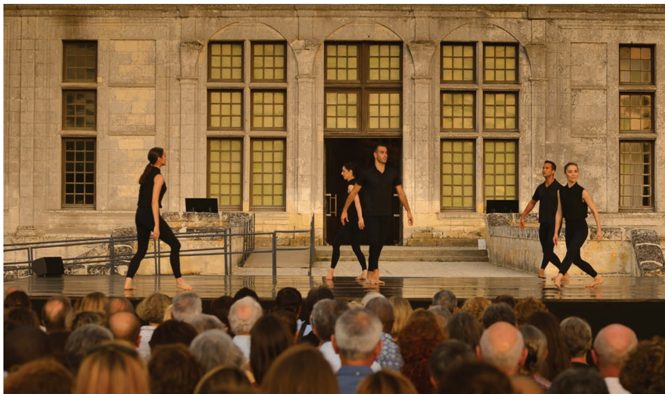
Festival de Chambord

Grand habitué du Festival, où il a déjà clôturé (à guichet fermé) la grande majorité des éditions, l'Orchestre Symphonique Région Centre-Val de Loire/Tours revient pour le dernier concert de ces deux semaines musicales.