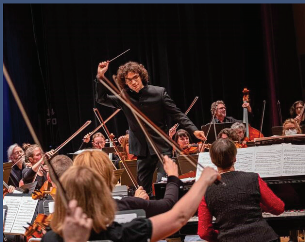
Orchestre Symphonique du Loiret

Cette nouvelle édition s'ouvre avec l'évocation des destins croisés de trois souveraines emblématiques qui ont inspiré trois grands compositeurs : l'impératrice romaine Agrippine la Jeune délicatement dépeinte dans l'œuvre de Haendel, Queen Mary qui a offert à Purcell quelques-unes de ses plus belles pages et la reine Aliénor d'Aquitaine dont la vie est mise en musique par Thierry Escaich sur un poème d'Olivier Py (création 2023). Ce programme, dans lequel les trois héroïnes sont incarnées par la chanteuse lyrique Patricia Petitbon, propose ainsi un dialogue, une mise en miroir entre musique baroque et création contemporaine. Une première soirée « royale » qui traverse le temps et les mythes à travers la voix de l'une des plus grandes sopranos françaises, accompagnée par les sept instrumentistes de l'ensemble Amarillis.