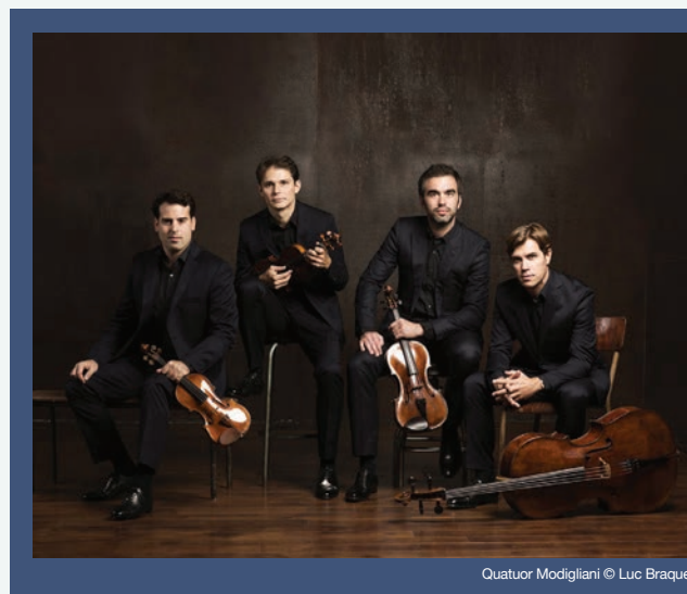
Quatuor Modigliani

[Cat. A/parterre : 50€ / 35€ - Cat. B/gradin : 30€ / 20€]