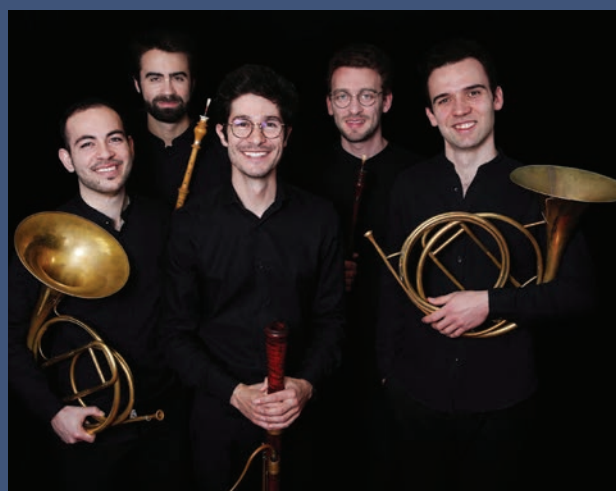
Quintette, Festival de Pâques d'Aix-en-Provence