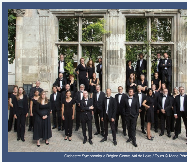
Orchestre Symphonique Région Centre-Val de Loire / Tours

[Cat. A/partierre : 50€ / 35€ - Cat. B/gradin : 30€ / 20€]