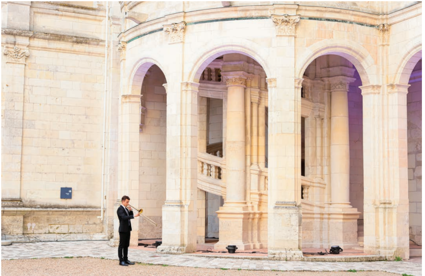
Festival de Chambord

Cette année, les deux semaines de musique débutent par une grande soirée mettant à l'honneur les femmes : trois souveraines (Aliénor d'Aquitaine, Agrippine la Jeune et Queen Mary) incarnées par la voix de la soprano Patricia Petibon accompagnée des musiciens de l'ensemble Amarillis dirigé par Héroïse Gaillard. Si la majorité des concerts ont lieu sur la scène installée dans la cour du château (493 places), le monument et ses jardins sont également investis lors de trois soirées. Le grand événement sportif que la France s'apprête à accueillir cet été n'est pas oublié puisqu'un spectacle labellisé « Olympiade culturelle – Paris 2024 », mêlant musique baroque, danse hip hop et skateboard, a intégré cette nouvelle programmation (7 juillet).