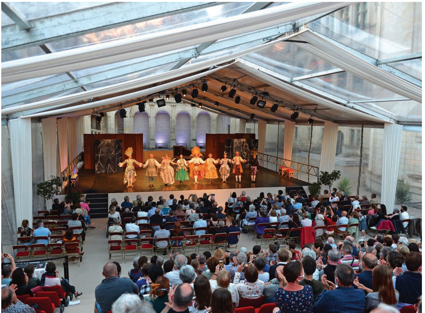
Festival de Chambord

L'ensemble Sarabacanes fait découvrir comment sonnaient les cors dits « naturels » à la fin de l'époque baroque en faisant voisiner d'authentiques sonneries de chasse avec des Ouvertures de Telemann , offrant à ces instruments d'usage « populaire » une place nouvelle au sein de l'orchestre.