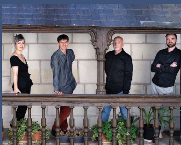
Diabolus in Musica

Formé il y a 20 ans et régulièrement encensé par la presse, le Quatuor Modigliani s'impose parmi les quatuors les plus demandés de notre époque, invité régulier des grandes scènes internationales et salles prestigieuses dans le monde entier. Programmé pour la première fois au Festival de Chambord, il y interprète deux monuments de la musique de chambre. Le premier a été composé par Ravel, dont il maîtrise l'œuvre à la perfection ; le second, fruit de l'écriture novatrice de Beethoven, met en valeur les qualités indéniables du jeune et brillant quatuor français.