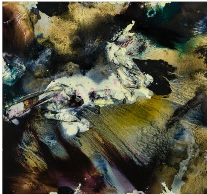
Lionel Sabatté, Chevauchée, chrysalide, 2022 - Huile, fragments de soie, poussières du Château de Chambord sur toile, 180 x 195 cm