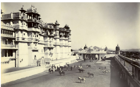
Vue du Manek Chowk, City Palace, Udaipur 1895-1905

En 2017, la famille Dreux signe un partenariat avec Chambord pour permettre la numérisation, l'étude et la présentation d'une partie de ce fonds remarquable.