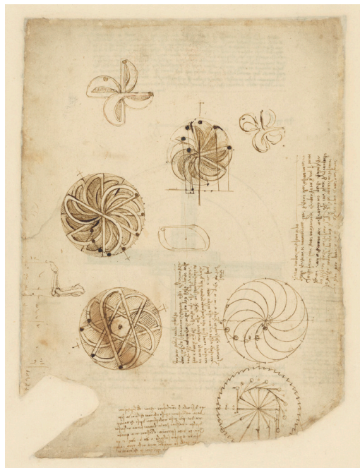
Codex Atlanticus : Études de physique sur le contrepois et le mouvement perpétuel (Fol.1062) Léonard de Vinci Veneranda Biblioteca Ambrosiana -Pinacoteca (Milan) Exposé dans une salle entièrement consacrée aux manuscrits de Léonard de Vinci

Dans le cadre des célébrations de son 500 e anniversaire, le Domaine national de Chambord propose au public une exposition exceptionnelle, la plus importante de son histoire, sur un sujet inédit : Chambord au passé et au futur.