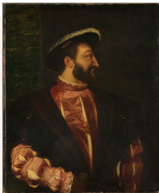
François I er , roi de France, Tiziano Vecellio, dit Titien Vers 1539 Paris, Musée du Louvre, Département des Peintures

La présentation de manuscrits enluminés du IX e au XVI e siècle, livres rares, dessins, tableaux, maquettes et objets d'art, parmi lesquels trois feuillets originaux du Codex Atlanticus de Léonard de Vinci, l'Armure aux lions de François I er ou encore cinq dessins originaux sur vélin exécutés par le célèbre architecte Jacques Androuet du Cerceau, permettra au public de véritablement entrer dans l'architecture du monument, et d'en saisir la nouveauté radicale.